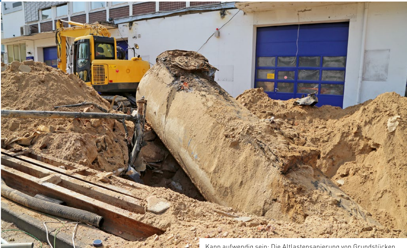
Kann aufwendig sein: Die Altlastensanierung von Grundstücken

Von Diego Frey